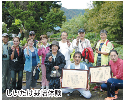
しいたけ栽培体験