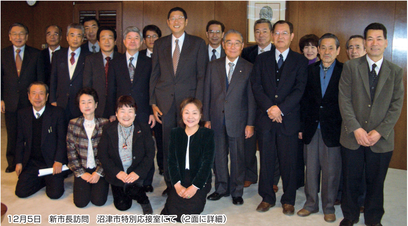
12月5日 新市長訪問 沼津市特別応接室にて (2面に詳細)

No. 10 発行者 沼津市商工会 会長 松永公良 〈本所・原支所〉沼津市原1200番地の1 TEL (055) 966-1331 FAX (055) 967-4925 〈戸田支所〉沼津市戸田1028番地の5 TEL (0558) 94-2224 FAX (0558) 94-4029 編集 沼津市商工会広報委員会