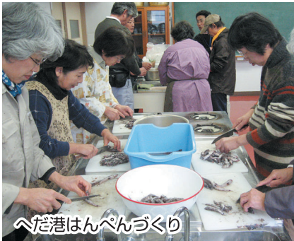
へだ港はんぺんづくり

一戸建てで少し農地のある物件を借りて、戸田と都会を行ったり来たりしたいという声を数多く聞かれました。なお、昨年の田舎暮らし体験ツアーの様子は、沼津市商工会のホームページの中で動画で配信されています。