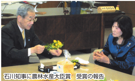
石川知事に農林水産大臣賞 受賞の報告