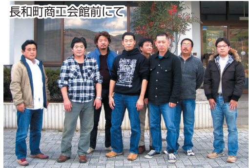
長和町商工会館前にて

ねましたが、「こうした商品券を待っていた」と歓迎する声が聞かれたほか、「このお店でも取り扱って欲しい」という利用者の要望もありました。加盟店には何のリスクもありません。この商品券を扱う加盟店には、何の手数料も負担もかかりません。既に地域に巡回している分でもかなりの金額になります。これからの利用を促す広報を行っていきますので、商品券加盟店への参加をお願いします。