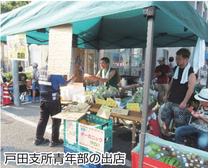
戸田支所青年部の出店