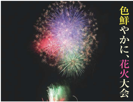
色鮮やかに、花火大会