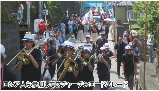
ロシア人も参加してプチャーチンロードパレード

今年「日本におけるロシア年」ということで、シンポジウム等の各種交流イベントが同日開催されたこともあり、幕末期のロシア軍艦ディアナ号にまつわる史実に基づいて行われる「プチャーチンロードパレード」