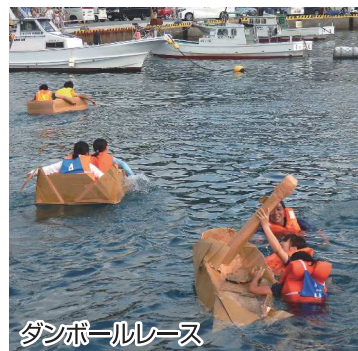
ダンボールレース