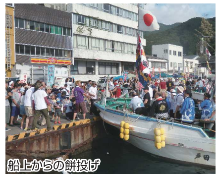
船上からの餅投げ