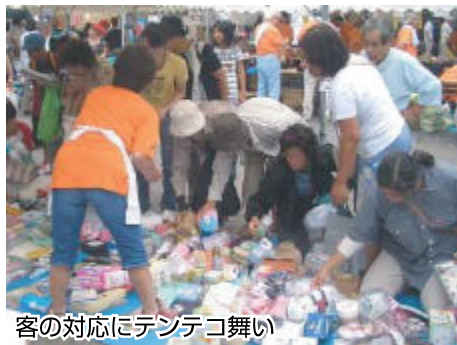
客の対応にテンデコ舞い