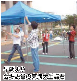
早朝より会場設営の東海大生諸君