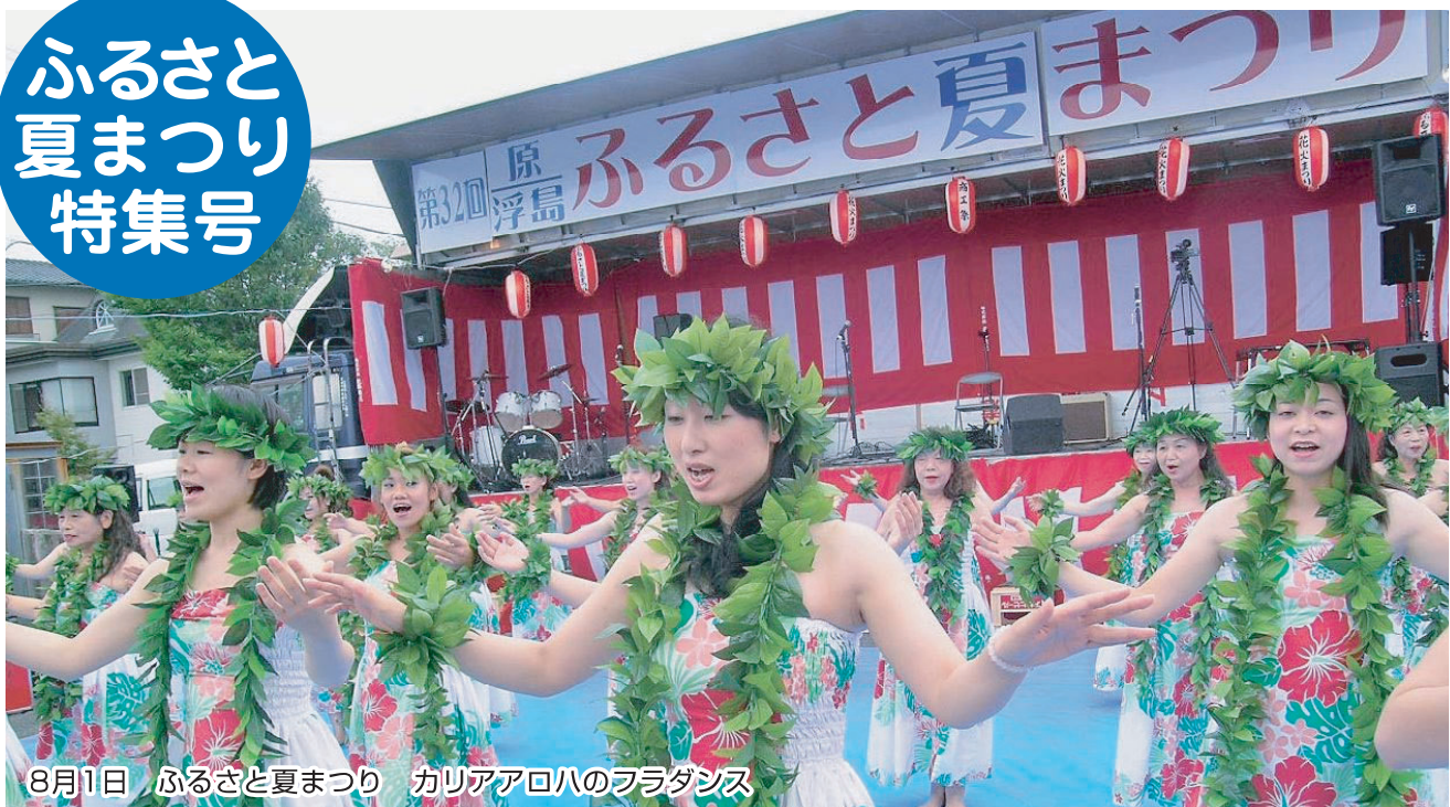
8月1日 ふるさと夏まつり カリアアロハのフラダンス