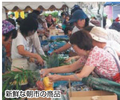
新鮮な朝市の商品

心配された雨もなく今日はいけるぞと張り切って朝七時に会員と産直市に集合し、出店準備の支度をして地区センターに向かいました。会場では、野菜を並べている頃からお客さんがぞくぞくと集まってきて品物に目を配り、販売開始の三〇分ぐらい前には大勢の人が周りに群がるほどの賑わいでした。販売が始まるとあつという間にすべての野菜が売りきれしてしまいました。地産地消をモットーに地元で取れた、安くて新鮮で安心して食べられる野菜を提供しましたのでお客様からは好評をいただいたと思っています。出店のトップバッターとしてお祭りを盛り上げ一〇時三〇分には次にボタンタッチし