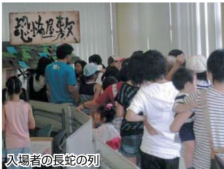
入場者の長蛇の列

今年も原・浮島地区の各PTAと子供会が参加し中学生・高校生・ペルーの子供達、そして一般のボランティアと多くのスタッフが揃い思い思いのアイデアを生かして完成しました。今回はお化けに扮してお客さんを驚かす事に力を入れ、昨年よりさらにバイジョンアップし途中でリタイヤーが続出、後半のブースではお客さんが来ないと嘆いていました。