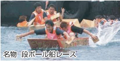
名物 段ボール船レース

ス部会は午後、後に車と船とに分かれて到着。会場はお祭り騒ぎです。テージではカラオ