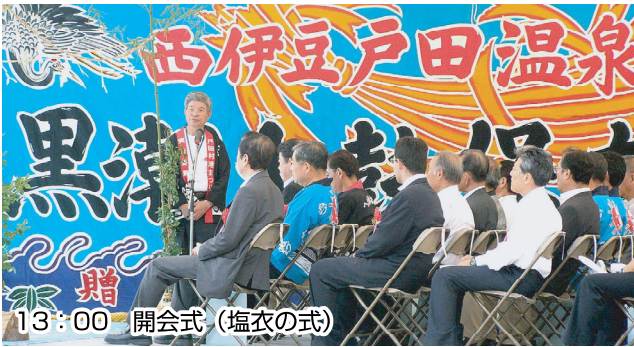
13:00 開会式 (塩衣の式)