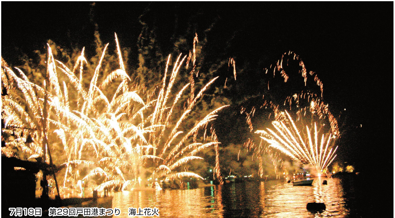
7月19日 第29回戸田港まつり 海上花火