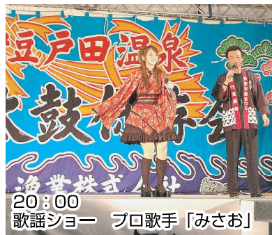
20:00 歌謡ショー プロ歌手「みさお」