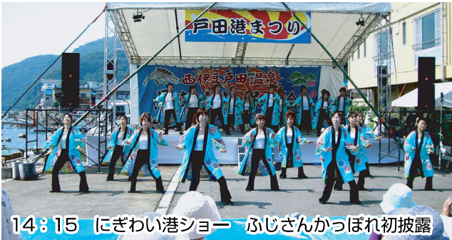
14:15 にぎわい港ショー ふじさんかつぼれ初披露