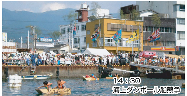
14:30 海上ダンボール船競争