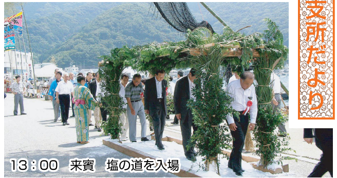
13:00 来賓 塩の道を入場