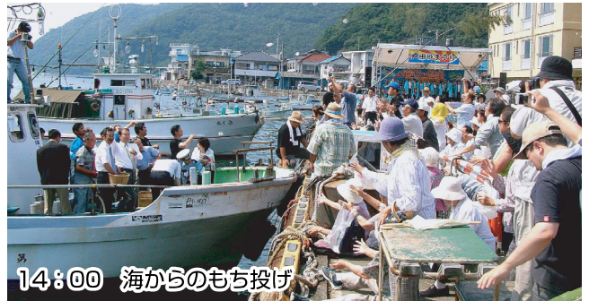
14:00 海からのもち投げ