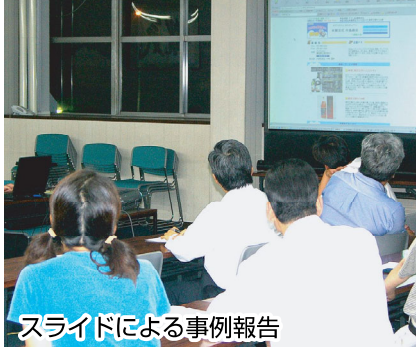
スライドによる事例報告