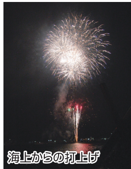
海上からの打上げ

よさこいが終わると、なだれ打つように、お待ちかねの花火大会がスタート。今年も25分で約1000発の花火が打ち上がり、お祭りのフィナーレを飾りました。