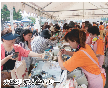
大盛況 婦人会バザー