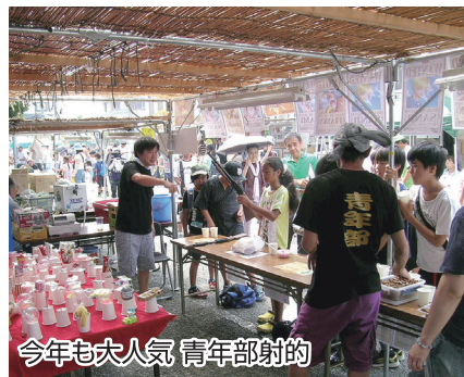
今年も大人気 青年部射的