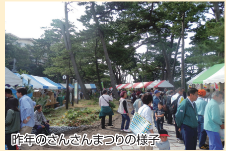
昨年のさんさんまつりの様子

★地場産品直売! ☆友好市町村特産品販売! ★B級グルメフェア開催! ☆カラクジなし!ガラガラ抽選会 ※他にも楽しいステージなど 盛りだくさんの内容を企画中!