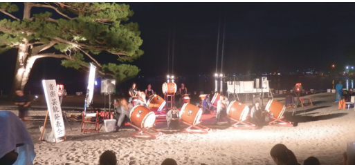
昨年のごぜ芸能まつりのステージ