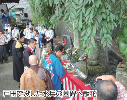
戸田で没した水兵の墓碑へ献花