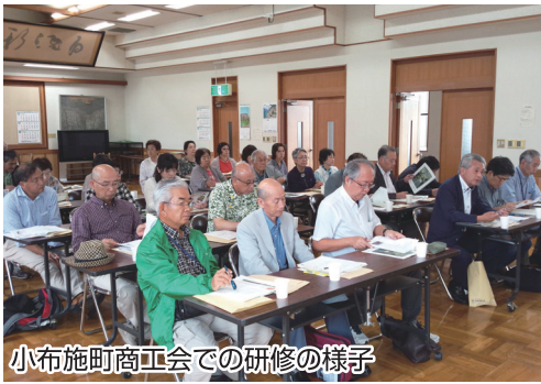
小布施町商工会での研修の様子

7月8日(水)、沼津市商工会「道の駅」プロジェクト推進活動の一つとして、まちづくりや道の駅設立の先進事例を学ぶため、年間約100万人もの観光客が訪れる長野県小布施町へ視察研修会を開催しました。