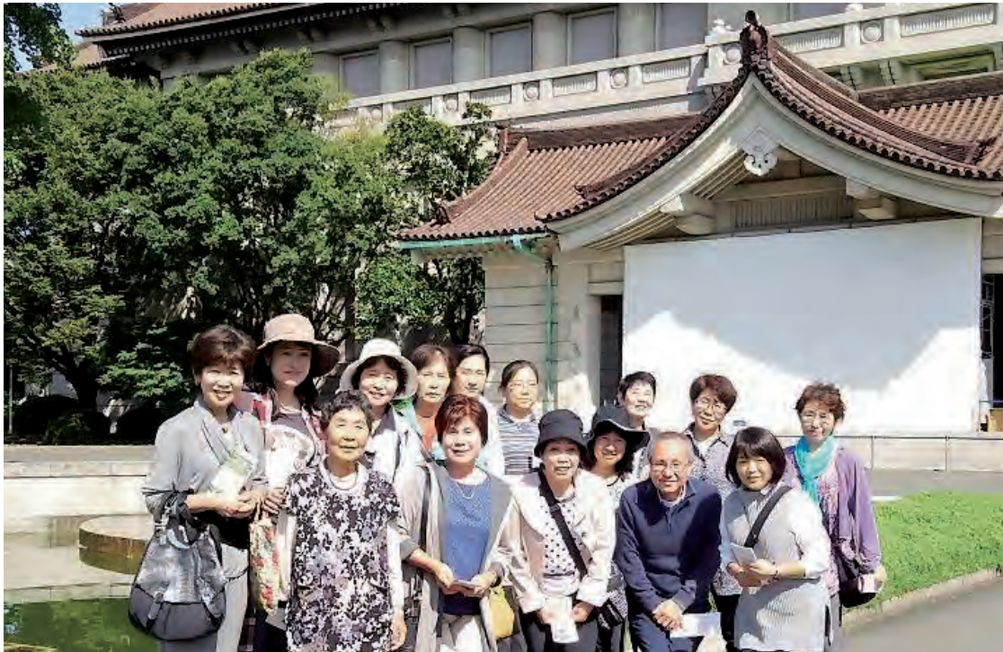
10月4日 於 東京国立博物館(2面に詳細)