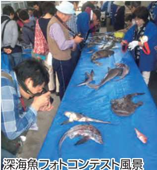
深海魚フォトコンテスト風景