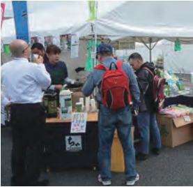
10月10日～11日 富士スピードウェイ (世界耐久選手権)