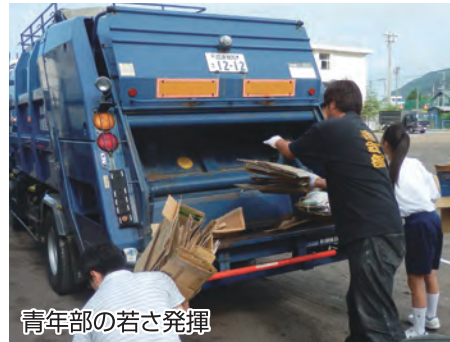
青年部の若さ発揮