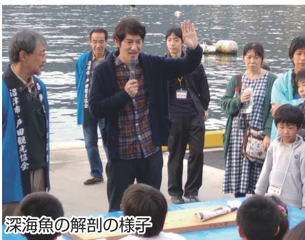
深海魚の解剖の様子

深海魚の撮影だけでなく、水揚げの様子が見学できたり、魚の解剖や深海魚料理の試食まで楽しめるのも魅力。予想以上の反響にスタッフ一同手応えを感じています。