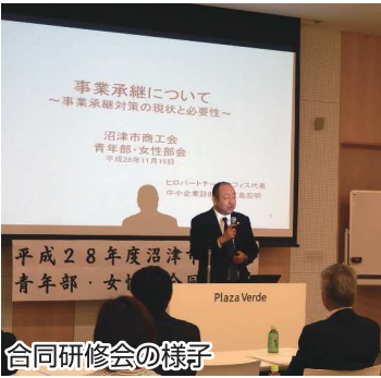
合同研修会の様子

研修会後には懇親会も行い、研修時間内では聞くことのできなかった疑問点を講師にぶつけていました。また、受講した参加者の中には事業承継について不安があるため、講師に個別の指導をお願いすることとなった方もおり、大変有意義な研修会とすることができました。