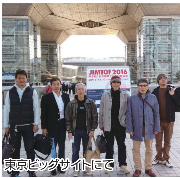
東京ビッグサイトにて

2日目は東京ビッグサイトで開催された『JIMTOF2016』（工作機械の見本市）を見学しました。ビックサイトの施設全体に最新の機械や工具が展示されており、1日では回りきれないようなスケールの大きさに圧倒されました。両部会の懇親会も開催され有意義な2日間となりました。