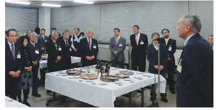
昨年の会員交流会の様子