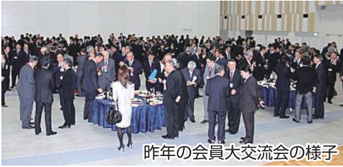
昨年の会員大交流会の様子