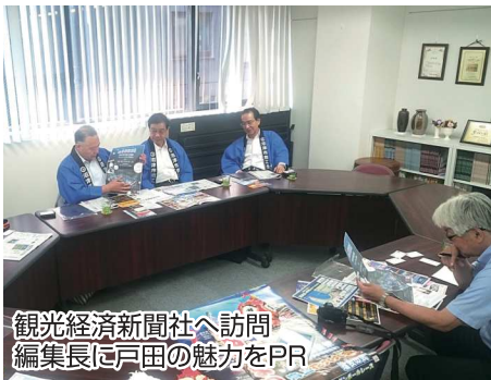
観光経済新聞社へ訪問 編集長に戸田の魅力をPR

6月23日（日）に、商工会戸田支所がマスコミキャラバンを実施しました。今回のキャラバンの目的は「戸田の夏の最新情報を全国へ発信」すること。定期船の試験運行や、深海生物館リニューアルなどのトピックを引っさげて、主に都内の報道機関や県の観光関係の機関を訪問しました。今回のキャラバンでは、各所で戸田のPRができただけでなく、これをキッカケとして、全国へ情報を発信する新たなルートも獲得することができました。実りの多いキャラバンとなりました。