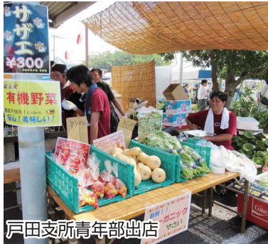
戸田支所青年部出店