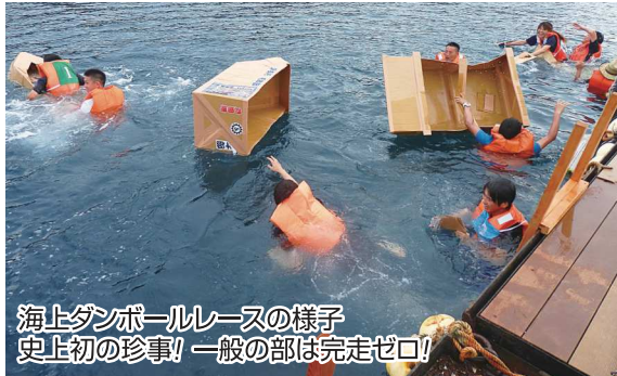
海上ダンボールレースの様子 史上初の珍事！一般の部は完走ゼロ！

ました。一般の部では、参加艇が次々と沈没し、前代未聞の「完走者なし！」という珍事となりました。