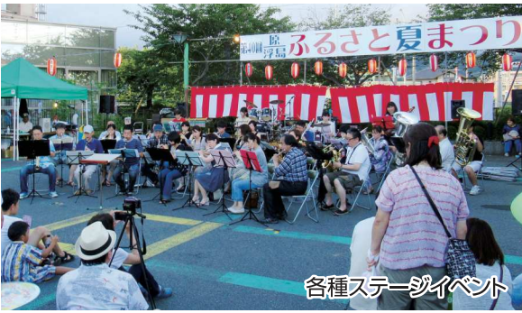
各種ステージイベント